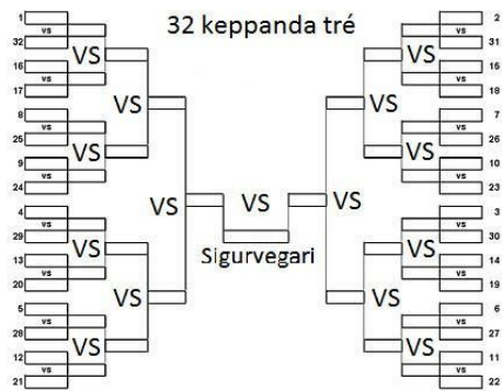
Mynd 5: 32 keppenda útsláttartré.