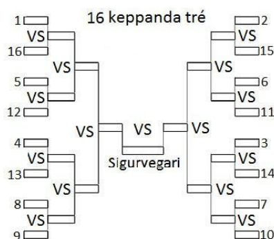
Mynd 4: 16 keppenda útsláttartré.