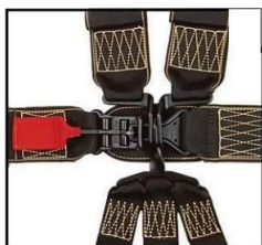
Mynd 1 a - Sleðalás