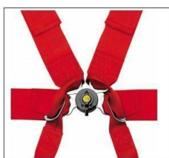
Mynd 1 b - Stjörnulás