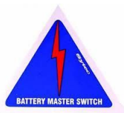
Mynd 2: Útlit merkimiða fyrir