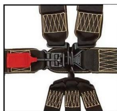
Mynd 1 a - Sleðalás

8.3.1 Öryggisbelti skulu vera samkvæmt stöðlum (FIA eða SFI) að lágmarki 3" breið, mjórri belti yfir axlir til að passa betur í HANS búnað eru einnig leyfð. Lágmark fimm punkta festingar og stjörnulás eða sambærilegt. sjá myndir að neðan.