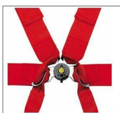
Mynd 1 b - Stjörnulás